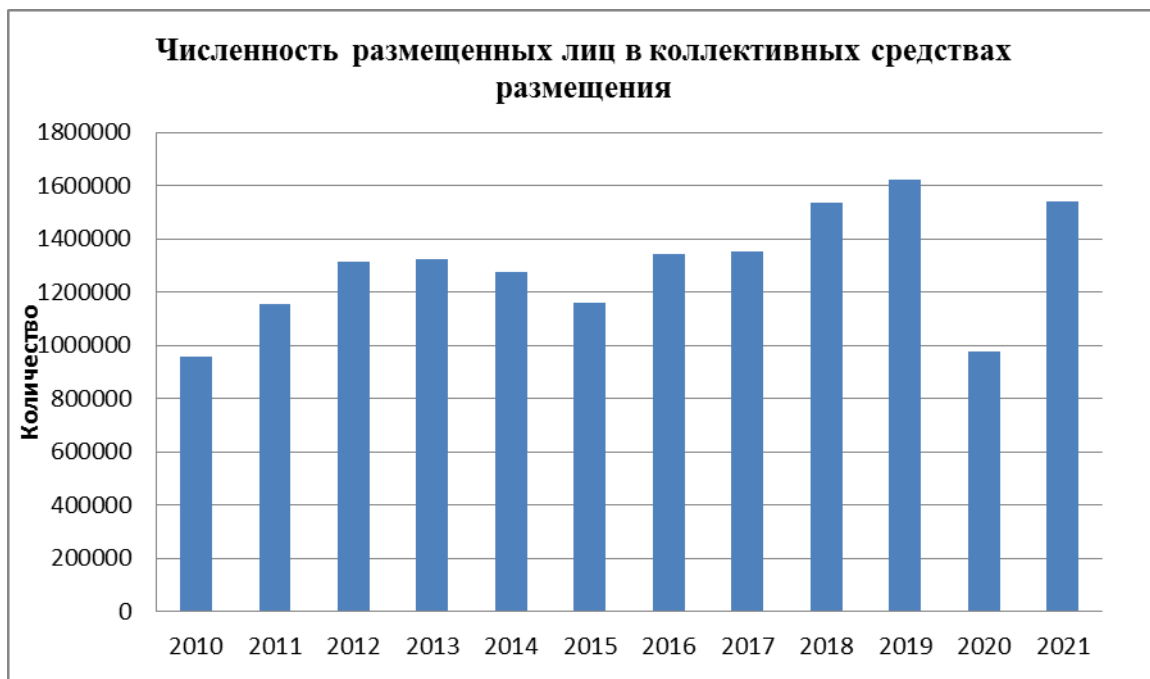
Рисунок 1 Численность размещенных лиц в коллективных средствах размещения Свердловской области