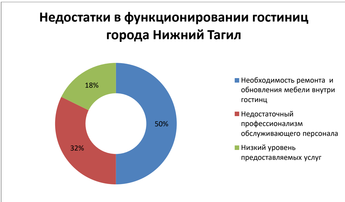
Рисунок 4 Недостатки в функционировании гостиниц города Нижний Тагил