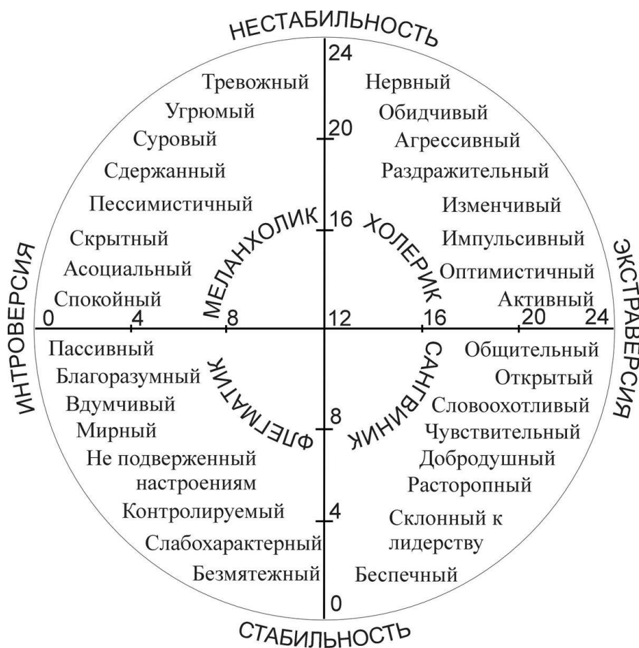
Рисунок 1. Круг Айзенка

Холерик = нестабильный + экстравертированный